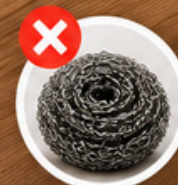
drátěnky, hrubé houby