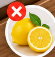
kyselé, citrusové přípravky