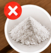
abrazivní čističe, písky